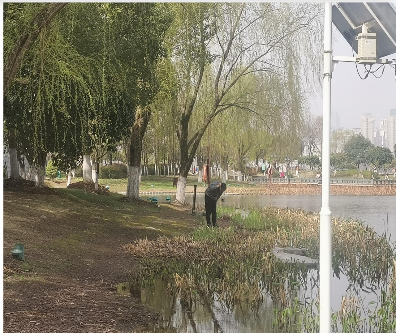
开展蚊虫幼虫孑孓监测