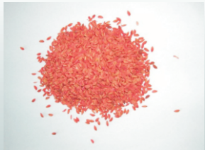
稻谷毒饵 慢性（溴敌隆）

市民能在正规鼠药销售点买到的慢性鼠药（一般是溴敌隆谷物毒饵）是较为理想的鼠药，其效果比以前的急性药更好。慢性鼠药对人畜很安全，万一误食或猫狗捕食数个中毒鼠导致二次中毒，可以到医院或宠物医院注射维生素K 1 解毒。