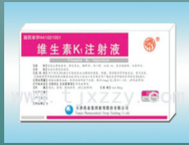
鼠药中毒可用 维生素K 1 解毒