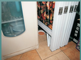
用一次性醋碟或 小瓷盘盛放毒饵

鼠药投放在老鼠经常活动、隐蔽、干燥的角落（鼠药受潮易发酶、失效）。一般每15平方米投放2堆药，最好用一次性醋碟或小瓷盘盛放，每堆20克左右。观察补药是鼠药灭鼠成败的关键，3~5天观察一次。观察发现鼠药吃完，则应加倍投放鼠药；没有吃完，则吃多少补多少。无盗食时，则调整投放地点。老鼠不间断取食鼠药效果最好，当取食到一定量时，老鼠会在4~20天亡。