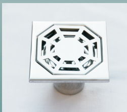
金属地漏或厕所防臭器

了解更多的灭鼠及除四害知识请上 武汉市疾病预防控制中心网站： www.whcdc.org