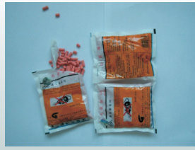
慢性（溴敌隆） 颗粒毒饵

鼠药投放在老鼠经常活动、隐蔽、干燥的角落（鼠药受潮易发酶、失效）。一般每15平方米投放2堆药，最好用一次性醋碟或小瓷盘盛放，每堆20克左右。观察补药是鼠药灭鼠成败的关键，3~5天观察一次。观察发现鼠药吃完，则应加倍投放鼠药；没有吃完，则吃多少补多少。无盗食时，则调整投放地点。老鼠不间断取食鼠药效果最好，当取食到一定量时，老鼠会在4~20天亡。