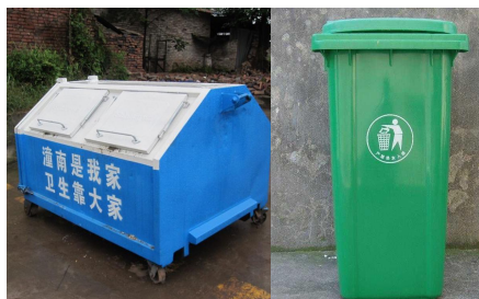
公园、动物园等室外使用带盖垃圾容器，及时清理垃圾，孳生蝇蛆的场所喷洒甲基嘧啶磷等杀虫剂杀灭