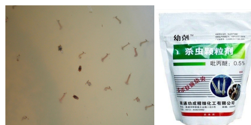
难以清除的积水可投放安备砂缓释剂等行灭蚊幼