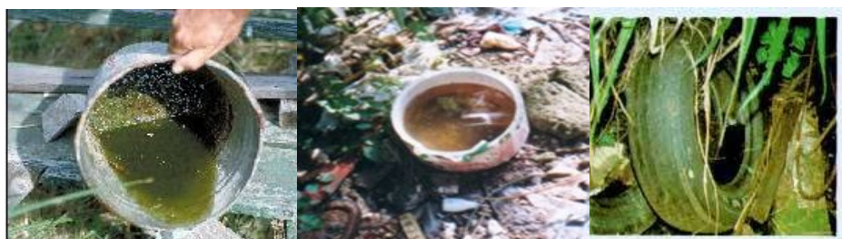
清除公园、动物园等各种废弃物和大小型积水