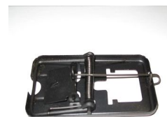
公园、动物园管理处等室内可选用粘鼠板、鼠笼、鼠夹等器械进行灭鼠，沿墙放置