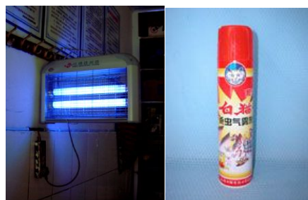
公厕安装灭蝇灯（不得靠墙，距离墙面20厘米以上）灭蝇，保持常亮状态，少量成蝇也可选用菊酯类杀虫剂灭蝇