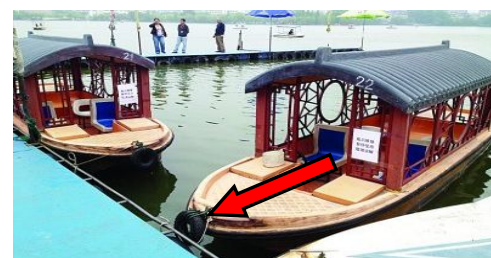
游船、划艇等防撞轮胎可进行钻孔，以防蚊虫孳生