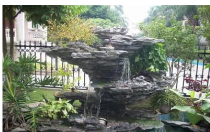
定期清理假山石窝里面积水防止蚊虫孳生