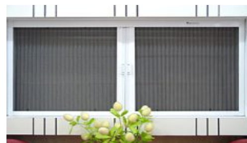
公厕与外界相通的排气孔或窗户可安装纱窗防止蚊、蝇进入