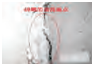
填补墙上缝隙，减少蟑螂孳生