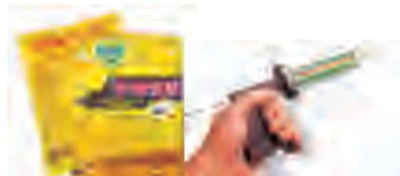
毒饵或胶饵灭蟑时，注意“点多、量少、分布均匀”，蟑螂密集处可适当增加点数

副食店、超市等经营单位应经常组织和发动员工做好周末大扫除活动，讲究卫生，垃圾做到日产日清。如果自行除害有困难的可以请专业除害公司进行除害。相关信息可以从武汉市疾病预防控制中心或武汉有害生物防制协会网站上查找，同时也可关注“武汉虫害防制”微信号或咨询12320公共卫生公益热线了解有关除害知识。