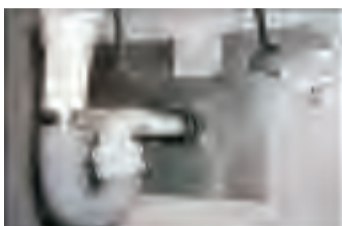
墙上的孔洞用硬物封闭（或堵塞）