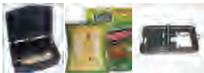
室内可选用带锁的毒饵盒、粘鼠胶、鼠笼、鼠夹等器械进行灭鼠，沿墙放置