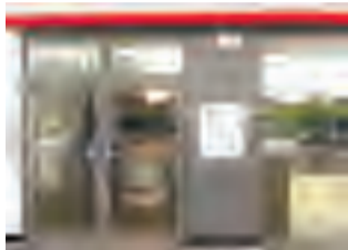
门窗严密，缝隙不大于6毫米