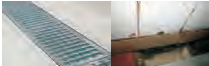
排水沟用带孔的金属板严密封闭，下水道出水口出安装可以拔插的竖算子，最大缝隙不大于10毫米