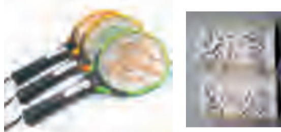
室内少量成蝇可选用灭蝇拍或粘蝇纸等工具进行灭蝇