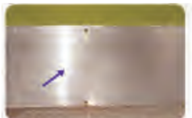
库房等房门钉金属铁皮，高度不低于30厘米，与地面缝隙不大于6毫米