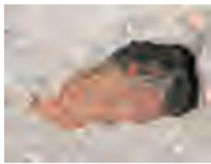
厕所周边地面硬化处理，有鼠洞的地方投放鼠药灭鼠，再进行堵洞