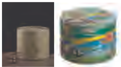
蚊虫繁殖高峰的夏秋季节，厕所内可点盘香或蚊香进行驱蚊