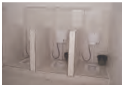
改用水冲式厕所，并保持厕所室内清洁卫生，及时冲洗大便池