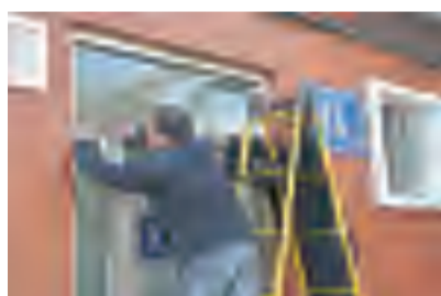
厕所入口处安装塑料门帘防止苍蝇进入，门帘底部离地面不大于2厘米