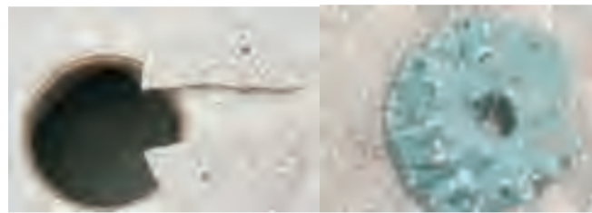
修复破损的化粪池盖子及周边地面，发现化粪池内有老鼠，用细铁丝挂蜡块毒饵灭鼠