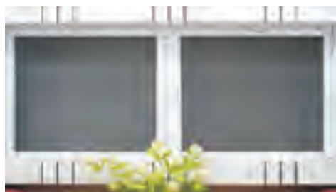
与外界相通的排气孔或窗户可安装纱窗防止蚊、蝇进入