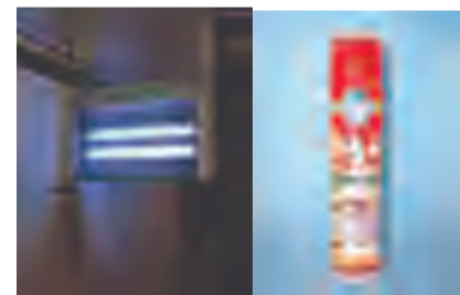
室内安装灭蝇灯（不得靠墙，距离墙面20厘米以上）灭蝇，保持常亮状态，少量成蝇也可选用菊酯类杀虫剂灭蝇