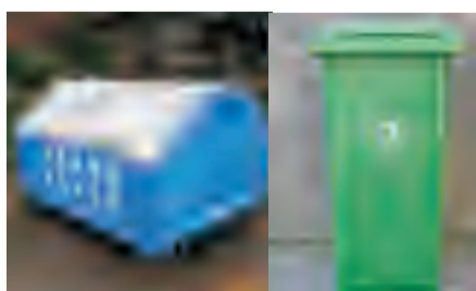
厕所周边使用带盖垃圾容器，及时清理垃圾，孳生蝇蛆的场所喷洒甲基嘧啶磷等杀虫剂杀灭