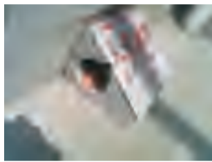
厕所内外分别设置1-2个毒饵站灭鼠