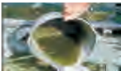
清除厕所内外各种大小型积水