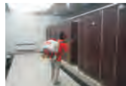
厕所室内及周边有苍蝇孳生的地点可定期使用菊酯类杀虫剂进行灭蝇