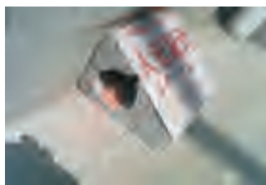
转运站内外分别设置2-3个毒饵站灭鼠