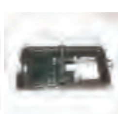
室内可选用粘鼠板、鼠笼、鼠夹等器械进行灭鼠，沿墙放置