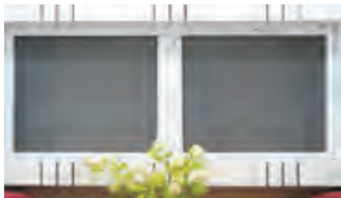
与外界相通的排气孔或窗户可安装纱窗防止蚊、蝇进入