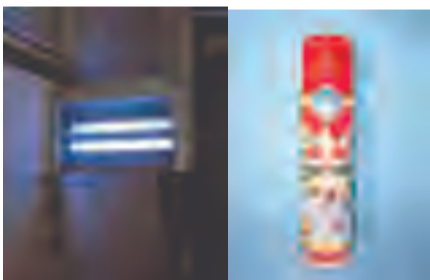
室内安装灭蝇灯（不得靠墙，距离墙面20厘米以上）灭蝇，保持常亮状态，少量成蝇也可选用菊酯类杀虫剂灭蝇