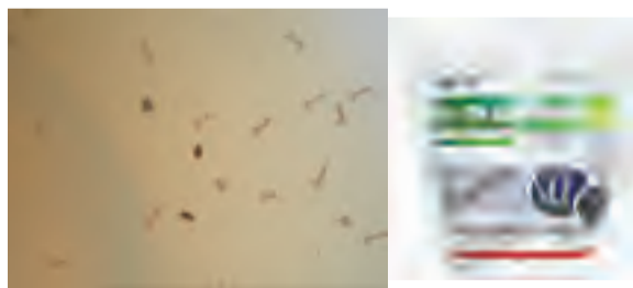
难以清除的积水可投放安备砂缓释剂等灭蚊幼