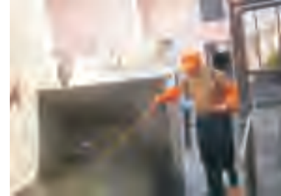
室内及周边有苍蝇孳生的地点可定期使用菊酯类杀虫剂进行灭蝇