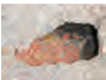
转运站周边地面硬化处理，有鼠洞的地方投放鼠药灭鼠，再进行堵洞