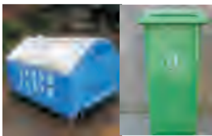
转运站周边使用带盖垃圾容器，及时清理垃圾，孳生蝇蛆的场所喷洒甲基嘧啶磷等杀虫剂杀灭