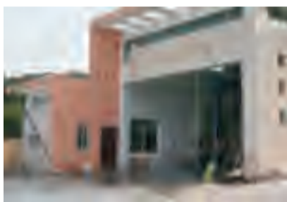
转运站垃圾做到日产日清，保证室内外无散落垃圾，并及时清洗地面